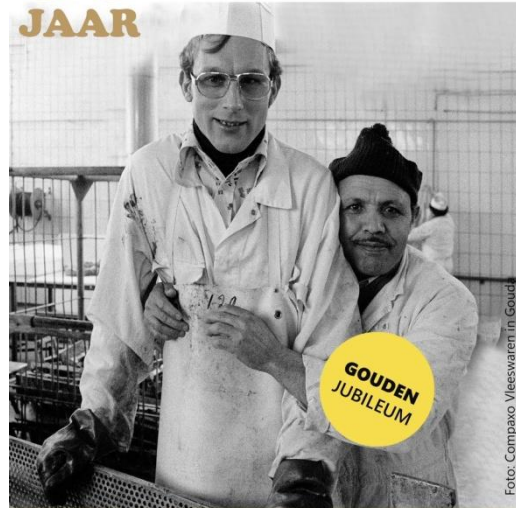
Foto: Compaxo Vleeswaren in Gouda

Boekpresentatie - Reizende foto-expositie - Netwerkbijeenkomsten Lezingen en Dialoogbijeenkomsten