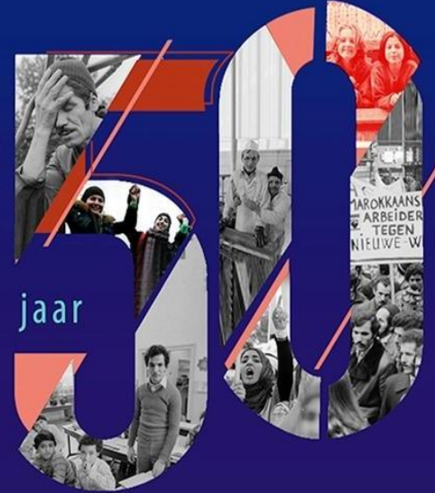
FOTO-EXPOSITIE '50 JAAR MAROKKAANSE MIGRATIE'